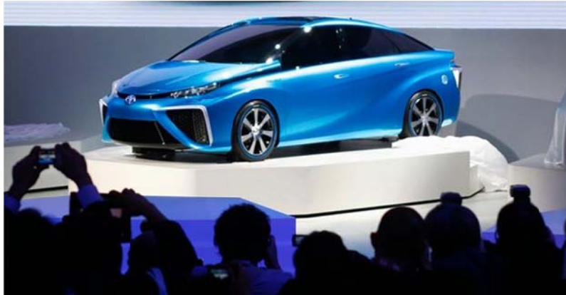
ภาพที่ ๑ รถต้นแบบที่ใช้พลังไฮโดรเจนจากค่ายรถยนต์โตโยตาเปิดตัวเป็นครั้งแรกในงานโตเกียวมอเตอร์โชว์เมื่อวันที่ ๒๒ พฤศจิกายน ๒๕๕๖ ที่ผ่านมามีพร้อมประกาศวางจำหน่ายรถยนต์รุ่นนี้ประมาณปี ค.ศ.๒๐๑๕ - ๒๐๑๖

พลังงานไฟฟ้าจากเซลล์เชื้อเพลิงไฮโดรเจนนั้นได้มาจากการทำปฏิกิริยาระหว่างแก๊สไฮโดรเจนและออกซิเจนเกิดเป็นกระแสไฟฟ้าและน้ำ ปัจจุบันราคาเซลล์เชื้อเพลิงยังสูงอยู่มาก ส่วนหนึ่งเป็นเพราะการนำแพลทินัมมาใช้เป็นตัวเร่งปฏิกิริยา อย่างไรก็ตามเมื่อเดือนตุลาคม ๒๕๕๖ ที่ผ่านมามีบริษัท Acal Energy ซึ่งตั้งอยู่ที่เมือง Runcorn สหราชอาณาจักรได้ประกาศสัมพันธ์เผยแพร่ว่าทางบริษัทสามารถคิดค้นเซลล์เชื้อเพลิงไฮโดรเจนที่มีราคาไม่แพงและมีอายุการใช้งานที่ยาวนานขึ้นได้สำเร็จโดยหลักการทำงานได้แสดงไว้ในภาพที่ ๒