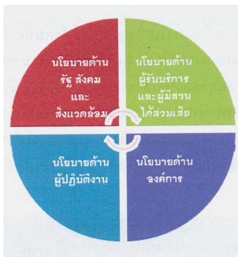
นโยบายหลัก 4 ด้าน

เพื่อแสดงความมุ่งมั่นต่อการบริหารราชการ ตามแนวทางของธรรมาภิบาล กรมวิทยาศาสตร์บริการได้กำหนดนโยบายการกำกับดูแลองค์กรที่ดีไว้รวม 4 ด้าน ตามภาพ