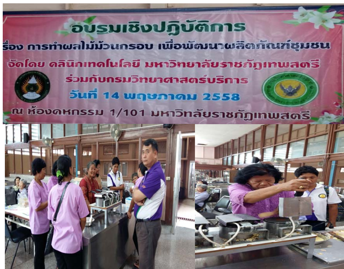
เครื่องมือและการอบผลไม้สุกม้วนกรอบแผ่นกรอบกรอบ