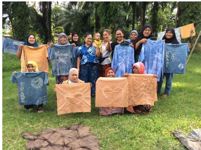
ภาพที่ 1-3 การลงพื้นที่จัดฝึกอบรมให้กับผู้ประกอบการผ้าบาติก จังหวัดกระบี่