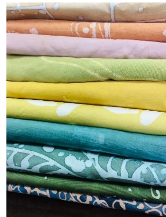
ภาพที่ 4-6 ผ้าบาติกย้อนมสัธรรมชาติ