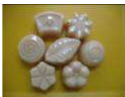
สบู่สมุนไพรที่ วศ. ได้พัฒนาสูตรขึ้น

กรมวิทยาศาสตร์บริการ (วศ.) โดยสำนักเทคโนโลยีชุมชน ได้ศึกษาหาวิธีการที่จะทำให้ได้สบู่ที่มีสมบัติเป็นไปตามที่ มผช. กำหนด โดยได้กำหนดสูตรเพื่อให้สบู่มีร้อยละของปริมาณไขมันเพิ่มขึ้น และปรับให้ร้อยละของปริมาณไฮดรอกไซด์อิสระลดลง